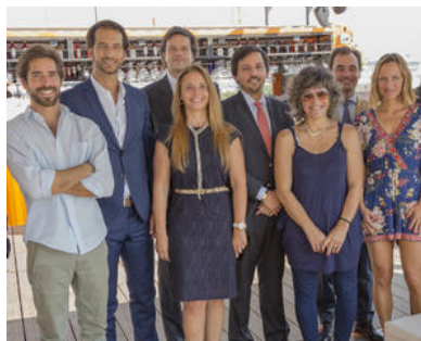
The New Generation - Imobiliário 4.0